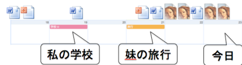
図1 ファイルと家族のスケジュール

上記(i)~(ii)におけるイベントを利用したファイル特定の手段は、個人のイベントだけでなく他人のイベントに関しても適用可能である。これらに加え、個人のイベントと他人のイベントの生起の相対関係により対象とするファイルを絞り込むことができる。