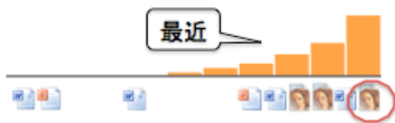
図2 時間が指定されている場合

「最近使用した、拡張子が不明なファイル」を指定した場合、結果として71件あるファイルから「最近」という時間情報に適合した30件が検索結果として反映された。最上位に出た結果は「010.jpg」であった。検索結果30件の中に中間発表.pptというファイルは存在するが、結果、上位には表示されていなかった。