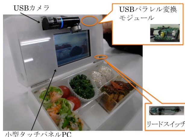
図2: プロトタイプの外観

ないように考慮した。また料理の蒸気や汁気、弁当箱を洗う際の洗剤や水がフタ部分に内蔵されているカメラやPCに触れることを防ぐ為に、おかずを入れる弁当箱本体部分には一回り小さいサイズの入れ物をアクリル板を用いて作り、二重構造にした。