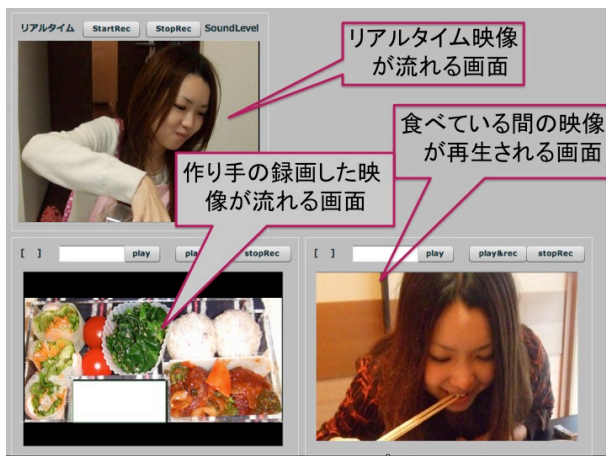
図 4: 使用時の画面例

また、カメラは上下に回転するのでお弁当内部だけでなく正面の映像も記録できる。食べ手の状態などに合わせてお弁当を撮影したり、食べ手自体を撮るなどの活用ができる。