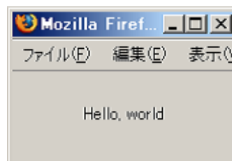
図 2: Firefox 上で hello.xul を実行

図 2 に示す。なお、Internet Explorer は XUL に対応していないため実行できない。